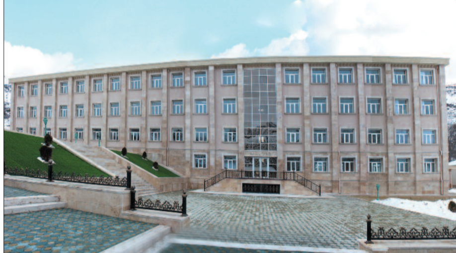
Biçənək kənd tam orta məktəbi

lərində eyni ab-hava olmuşdur. Çünki Sovet hakimiyyəti illərində bütün başqa sahələrdə olduğu kimi, məktəblərə dövlət səviyyəsində lazımı qayğı göstərilmədiyindən, demək olar ki, bütün məktəb binaları illər keçdikcə yararsız vəziyyətə düşmüşdür. Buna baxmayaraq, məktəblər uzun illər istismar müddəti çoxdan başa çatmış köhnə binalarda fəaliyyətini davam etdirmişdir. Müəllim və şagirdlər, əsasən, payız-qış mövsümündə çətinliklərlə üz-üzə qalmışlar. O vaxt nə çarə tapan, nə də çarə axtaran olmadığından bu problem ilbəl dərinləşmiş və təhsilin keyfiyyətinə mənfi təsir göstərmişdir.