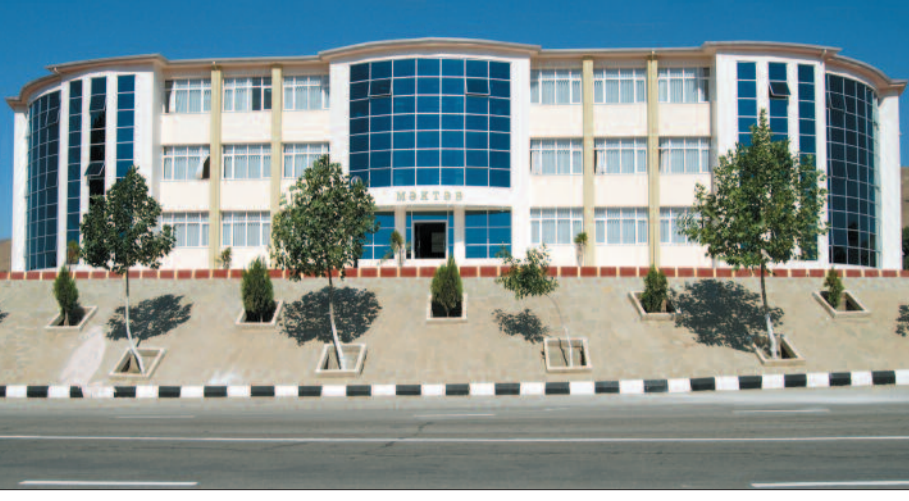
Şahbuz şəhər 1 nömrəli tam orta məktəb

1930-cu ilin dekabr ayında yaradılan Şahbuz rayonunun tarixinə nəzər salarkən burada həmin tarixdən 34 il əvvəl yaranmış məktəbin məzunları olan maarifpərvər ziyalının hərtərəfli fəaliyyəti diqqətə cəlb edir. Həmin məktəbin yetirmələri xalq təsərrüfatının bütün sahələrində fəallıq göstərmişlər. Arxiv materialları ilə tanış olarkən mənə belə bir təəssürat yarandı ki, Şahbuzun bir rayon kimi yaradılmasında ilk təhsil ocağımız Şahbuzkənd məktəbinin ziyalıları böyük təşəbbüskarlıq göstərmişlər. Elə bu baxımdan 119 yaşlı məktəbin yaradıcıları və onun tarixi haqqında danışımağa dəyər. Tarixi mənbələrə əsasən demək olar ki, 1896-cı ildə Naxçıvan qəzasının Şahbuz uyezdində açılmış ilk ikisinifli rus-tatar məktəbi bölgədə uzun müddət yeganə təhsil ocağı olmuşdur.