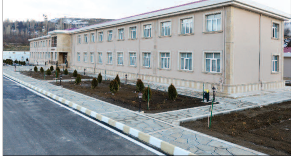
Nursu kənd tam orta məktəbi

şagird, sözsüz ki, dününkindən öz dünyagörüşü, intellekt səviyyəsi, maraqları və tələbatı ilə kəskin fərqlənir.